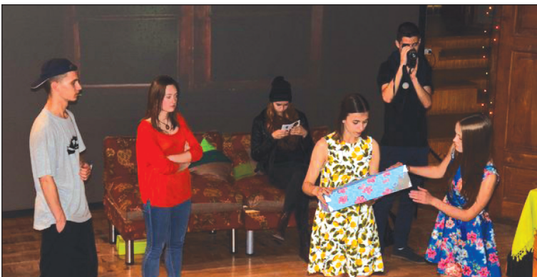
Fragments no izrādes «Durvis» pirmizrādes

Lai arī ko teiktu mēs paši un cilvēki no malas, uzskatu, ka pēdējos mēģinājumos mēs visi saņēmāmies un strādājām ar lielu atdevi. Lugas «Durvis» pirmizrāde bija ar neaizmirstamām emocijām apveltīta, pacilājums mūs nepameta vēl ilgi.