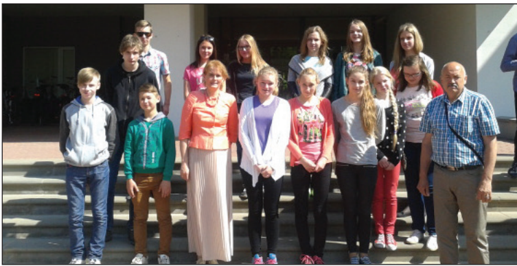
Talantu skolas aktīvākie un centīgākie bērni noslēguma ekskursijā