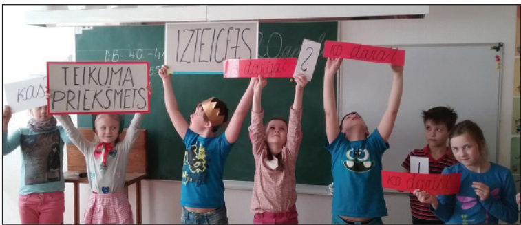
2. re klase iepazīstot teikuma veidošanas likumus un teikuma locekļus

dēta kā mūzikls, gatavojoties māmiņu dienai. Skatītāji secināja: «Mēs arī tā gribam!» 2.re klases skolēni atceras citādo mājturības stundu ar sniega figūru veidošanu skolas dārzā janvāra dienā. Bet grūtos teikuma veidošanas likumus un teikuma locekļus bērniem saprast palīdzēja karalis un karaliene, kas droši vadīja bērnus pa sarežģītajiem teikuma karaļvalsts labirintiem. Lai katra stunda jaunajā mācību gadā pārtop par citādo stundu!