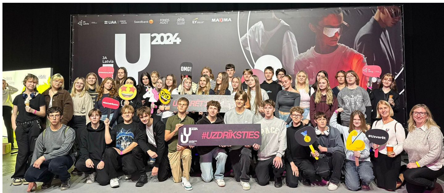
DESMITIE UZDRĪKSTAS UZVARĒT un gūst motivāciju.

Izvēlējos veidot skolēnu mācību uzņēmumu, jo interesēja, kā tas ir, kad pašam ir uzņēmums un kaut kas jāveido. Ar grūtībām saskārušies neesam, jo skolotājs vienmēr palīdz."