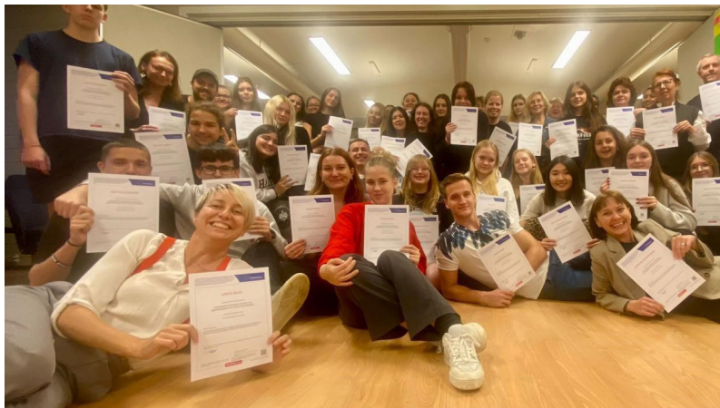
Mācību dalībnieki pēc noslēguma apliecību saņemšanas.