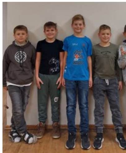
3. do klases puisi