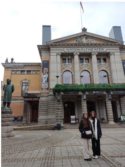
OSLO NACIONĀLAIS TEĀTRIS bija pirmais apskates objekts, ko ieraudzīja Kate un Madara, izkāpjot no tramvaja.