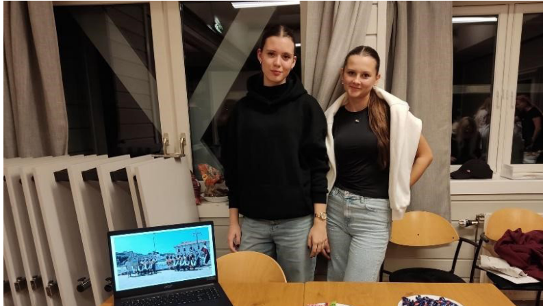
Madara un Kate Kultūru vakarā. Katra grupa savā stendā rādīja to, kas raksturo valsti, vietu un kultūru, kuru pārstāv