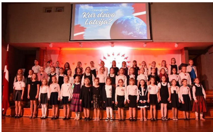
“KUR DŽĪVO LATVIJA?” KONCERTA ATKLĀŠANĀ koris iepriecināja skatītājus.