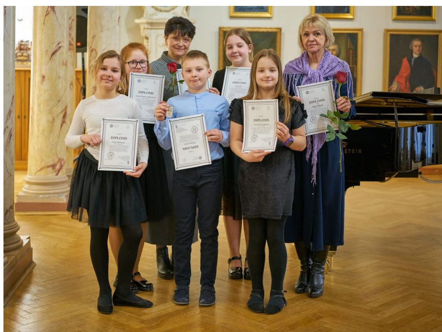
Jauno pianistu festivāls "Klavieres, populārā mūzika, džezs un improvizācija" 1. pakāpes diplomi